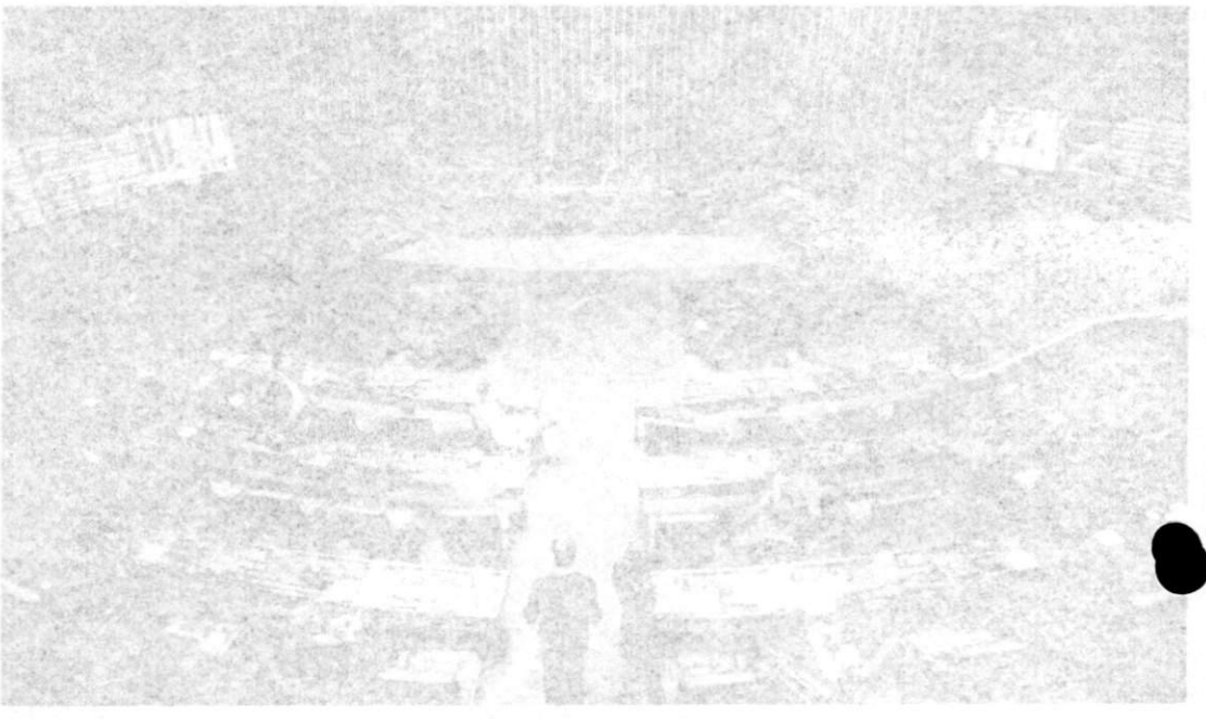
Prefeitura promove 1º Encontro de Formação de Redes de Escolas Comunitárias para gestores, professores e merendeiras de São Luis

Recursos elevados para R$ 15 milhões valor para aplicar recurso automático